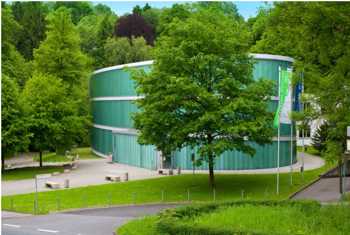
Neanderthal Museum